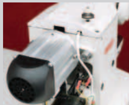
Silnik „synchro” o dużej mocy, umieszczony przy główce sprawia, że maszyna pracuje cicho i bez wibracji.

Пфафф 3371 обрабатывает пуговицы диаметром 8 – 32 мм