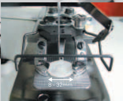
Maszyna 3371 przyszywa guziki o średnicy od 8 do 32 mm

Пфафф 3371 обрабатывает пуговицы диаметром 8 – 32 мм