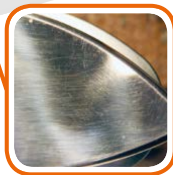
Антибликовая пластина для темных покрытий No shine plate for dark linings.