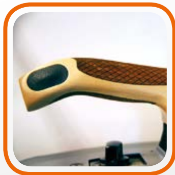
Деревянная рукоятка анатомической формы. Wooden and anatomic-shaped handle.