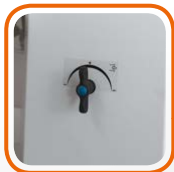
Регулируемая мощность вакуума Blowing suction power regulation.