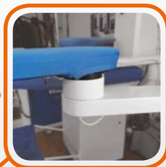
Универсальное крепление кронштейна диаметром 85 мм, гарантирующее сильное всасывание, с автоматическим переключением. Universal attack for arm diam. 85 with automatic switching.