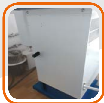
Регулировка высоты гладильного стола Surface ironing height adjustment with gas balancer.