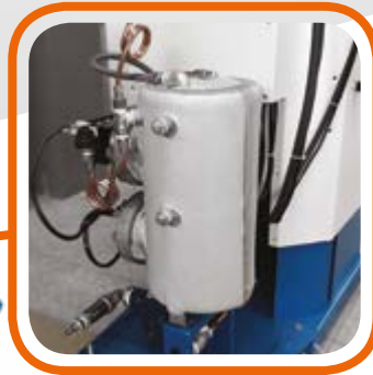
На столе установлен бойлер объемом 7 литров с автоматическим насосом. 7-liter boiler with automatic load-ing pump included in the table.