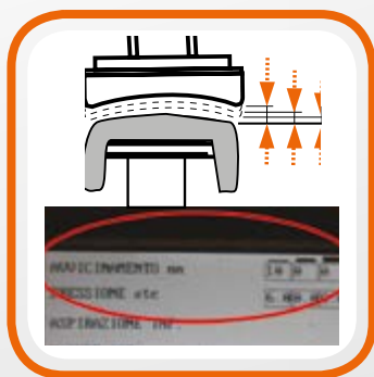
Регулируемое давление. Adjustable pressure.