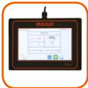
Полноцветный сенсорный экран программатора TCW 7 дюймов с USB и Wi-Fi. Full color touch screen program- mer TCW 7" with USB and Wi-fi