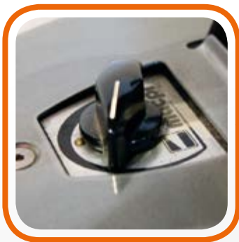
Регулировка температуры с помощью термостата. Temperature control by thermostat.