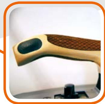
Деревянная рукоятка анатомической формы. Wooden and anatomic-shaped handle.