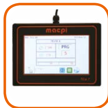
Программатор TCW с 7-дюймовым сенсорным экраном, USB и Wi-Fi, полностью удобен в использовании благодаря интуитивно понятному и многофункциональному дисплею. Full color touch screen programmer TCW 7" with USB and Wi-Fi, totally user-friendly with a multifunction in-tuitive display.