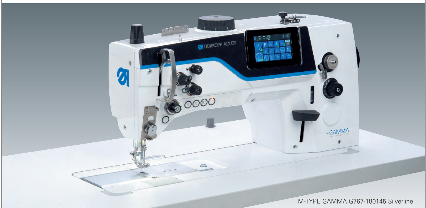
M-TYPE GAMMA G767-180145 Silverline

Das integrierte Touch-Bedienfeld ermöglicht eine komfortable Bedienung und Einstellung der spezifischen Maschinenfunktionen. Ein gezieltes Aktivieren von Funktionen im Nähprozess wird durch die im Arbeitsbereich ergonomisch angeordnete 6-fach Tasterleiste und dem Favoritentaster erzielt. Anwendungsbeispiel: Montage- und Steppnähte im mittel-schweren Anwendungsbereich