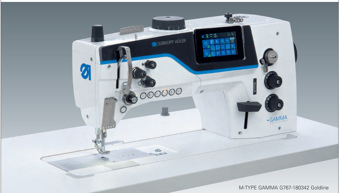
M-TYPE GAMMA G767-180342 Goldline

G767-280342 Goldline – die Zweinadel-Ausführung mit leistungsfähigen Zusatzfunktionen; ausgestattet mit übergroßen XXL-Vertikalgreifern (Ø 32 mm), 6-fach Tasterleiste, automatischen Grundfunktionen (Fadenabschneider mit ca. 15 mm Restfadenlänge) und weiteren Funktionen wie: Integrierte zweite Stichtlänge, integrierte zweite Fadenspannung, Hubschnellverstellung, Ölwarnanzeige und einer Stichtlänge bis max. 9 mm