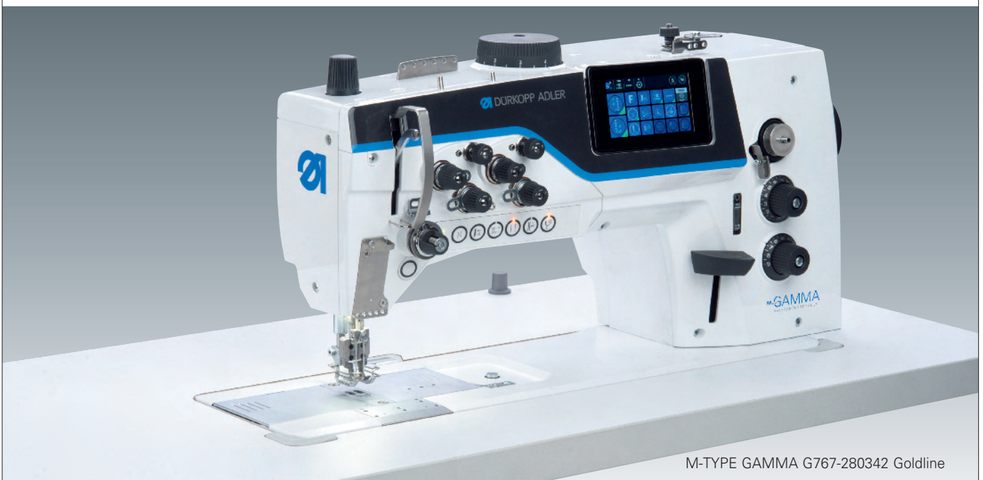
M-TYPE GAMMA G767-280342 Goldline